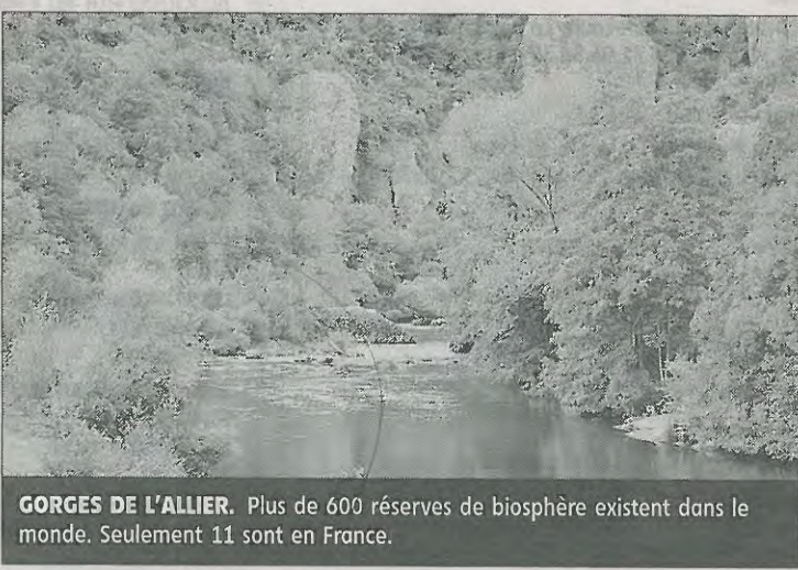
GORGES DE L'ALLIER. Plus de 600 réserves de biosphère existent dans le monde. Seulement 11 sont en France.

Pour l'obtenir, trois conditions sont à respecter : assurer la conservation des écosystèmes et des paysages, favoriser le développement économique et social (agriculture, tourisme...) et donner une large part aux recherches et aux études, à l'éducation et à l'implication de la population. La sensibilisation