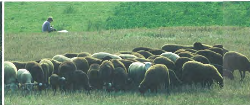
La "noire du Velay" au pâturage

anciennes pousse une mousse localisée, la Buxbaumie verte, et dans les sapinières de la Margeride, le Lycopode à rameaux. Au cœur des gorges, sur les replats basaltiques, la floraison de la Gagée de Bohème et de la Pulsatille rouge se succède dans le temps, alors que dans les falaises s'accrochent la Doradille du Forez et le Muflier à feuilles d'Asaret. En somme, une grande diversité biologique, liée à des écosystèmes qui fonctionnent naturellement et à leur utilisation équilibrée par l'homme.