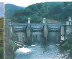
Barrage de Poutès-Monistrol

la Directive Habitats (Natura 2000) de l'Union Européenne, qui recense, rien que sur le Haut Allier, 51 espèces et 21 habitats naturels, dont 4 prioritaires !