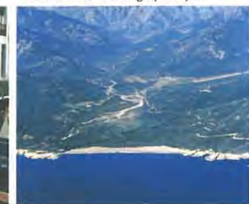
... de la Vallée du Fango (Corse)...