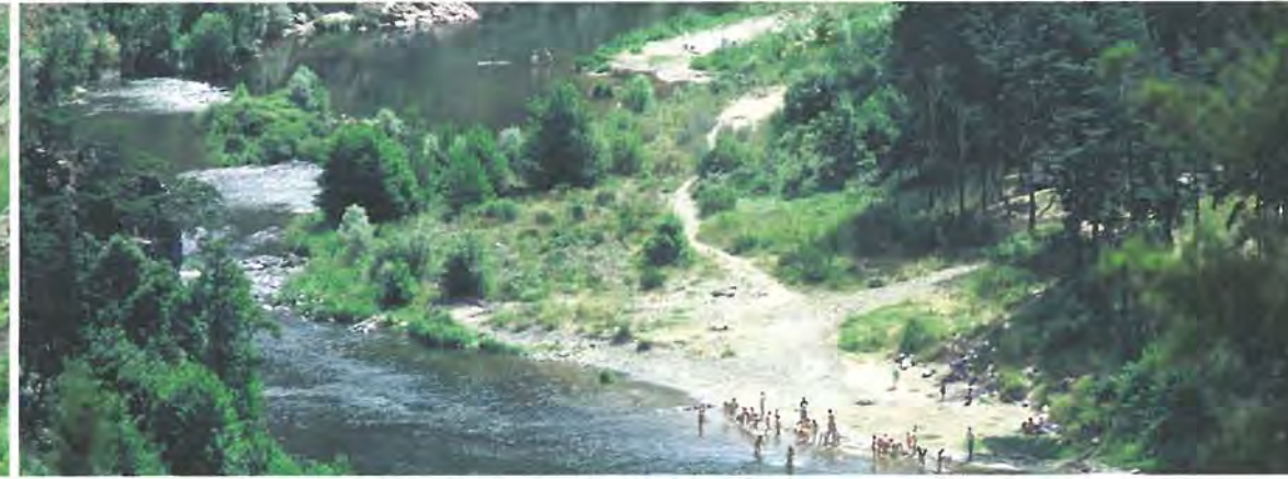
Baignade à Serre de la Fare, dans la Haute Vallée de la Loire