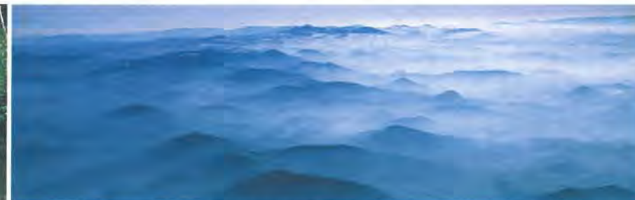
Les sucs de l'Yssingelais, autour du Meygal, dans la brume