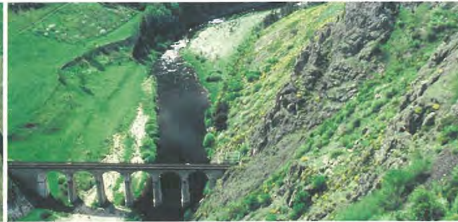
Viaduc sur le Haut Allier sur la ligne du "Cevennol"