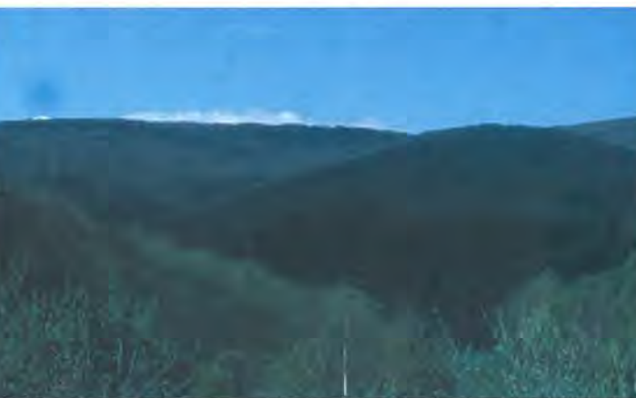
Sources de l'Allier, Mours de la Gardille

Le territoire des "Sources de la Loire et de l'Allier" correspond à cette exigence. Ses paysages préservés marquent une heureuse alternance entre l'activité humaine, imprégnée par une forme d'agriculture durable et la puissance de ses milieux naturels. Les gorges de la Loire et de l'Allier, peu altérées, recèlent de véritables trésors écologiques. Plusieurs milieux (forêts alluviales, landes à Genêts purgatifs) sont inscrits dans