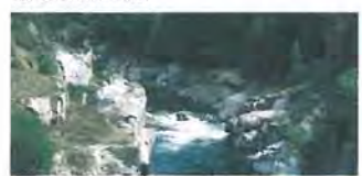
Barrage enlevé (St Etienne du Vigan), sur le Haut-Allier