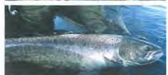
Saumon atlantique (Salmo salar)

Un des grands intérêts du territoire des sources de la Loire et de l'Allier est son histoire récente forte. Après avoir divisé les hommes, il rassemble aujourd'hui. Entre 1986 et 1994, associations de protection de la nature et aménageurs se sont affrontés autour de la question de l'aménagement des Hautes Vallées. Ce conflit, par delà les incompréhensions réciproques, a permis de prendre conscience de leur extraordinaire capital naturel. Aujourd'hui, avec l'adoption du "Plan Loire Grandeur Nature" (4-1-1994), les conséquences positives en sont très nombreuses. Pour sauver le Saumon atlantique, le SMAT 1 a construit la plus grande salmoniculture d'Europe à Chanteuges, sur le Haut Allier, devenu Conservatoire National du Saumon Sauvage en 2007. L'Etat a fait effacer le barrage de St Etienne du Vigan, pour faciliter les migrations et n'a pas renouvelé la concession du grand barrage de Poutès-Monistrol. L'aménagement de la Loire à Brives-Charensac, pour gérer le risque naturel de crues en élargissant le lit majeur du fleuve, est aussi exemplaire. Récemment, le Conseil Général de Haute-Loire a lancé un SAGE 2 sur la "Loire amont", permettant d'aborder le problème du transfert des eaux de la Loire dans l'Ardèche, via le barrage EDF de Lapalisse/Montpezat.