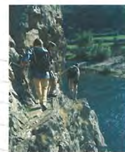
Randonnée en Haute vallée de la Loire

la Directive Habitats (Natura 2000) de l'Union Européenne, qui recense, rien que sur le Haut Allier, 51 espèces et 21 habitats naturels, dont 4 prioritaires !