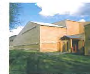
Salmoniculture de Chanteuges sur le Haut-Allier

Un des grands intérêts du territoire des sources de la Loire et de l'Allier est son histoire récente forte. Après avoir divisé les hommes, il rassemble aujourd'hui. Entre 1986 et 1994, associations de protection de la nature et aménageurs se sont affrontés autour de la question de l'aménagement des Hautes Vallées. Ce conflit, par delà les incompréhensions réciproques, a permis de prendre conscience de leur extraordinaire capital naturel. Aujourd'hui, avec l'adoption du "Plan Loire Grandeur Nature" (4-1-1994), les conséquences positives en sont très nombreuses. Pour sauver le Saumon atlantique, le SMAT 1 a construit la plus grande salmoniculture d'Europe à Chanteuges, sur le Haut Allier, devenu Conservatoire National du Saumon Sauvage en 2007. L'Etat a fait effacer le barrage de St Etienne du Vigan, pour faciliter les migrations et n'a pas renouvelé la concession du grand barrage de Poutès-Monistrol. L'aménagement de la Loire à Brives-Charensac, pour gérer le risque naturel de crues en élargissant le lit majeur du fleuve, est aussi exemplaire. Récemment, le Conseil Général de Haute-Loire a lancé un SAGE 2 sur la "Loire amont", permettant d'aborder le problème du transfert des eaux de la Loire dans l'Ardèche, via le barrage EDF de Lapalisse/Montpezat.