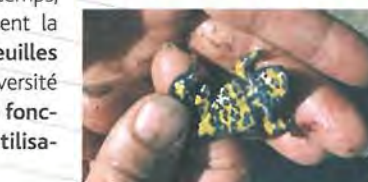
Sonneur à ventre jaune