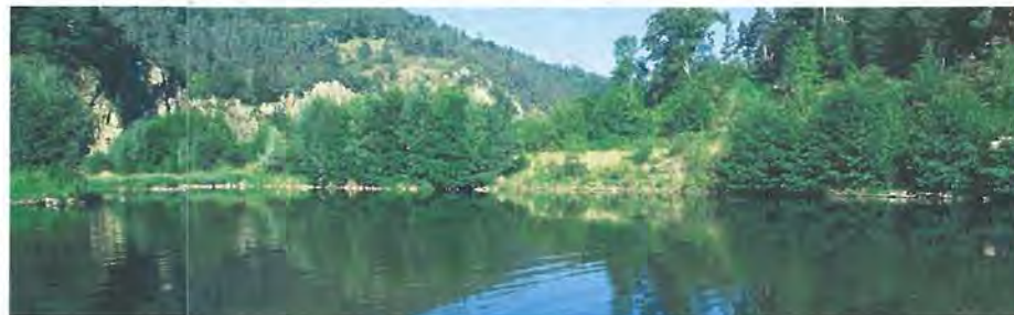
La Haute vallée de la Loire vers Goudet