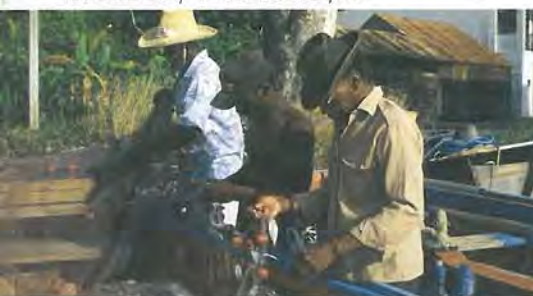
Réserve de biosphère : de Guadeloupe...