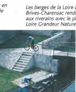
Les berges de la Loire à Brives-Charensac rendues aux riverains avec le plan Loire Grandeur Nature